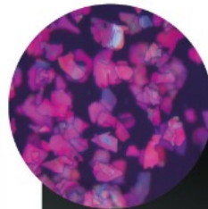
Mirinae Lux A-7409K Red