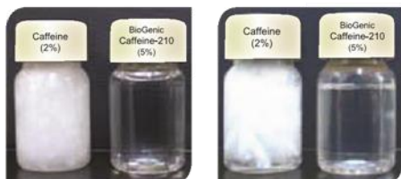
[ Solution ]

Biogenics社の“界面活性剤フリー可溶化技術”である、オリゴマコンプレックス技術により、高濃度のカフェインを水に溶解することが可能です。